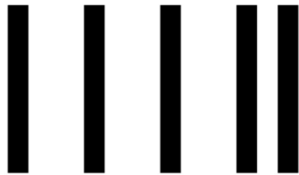
Mit Klatschen steuern - 1x, 2x