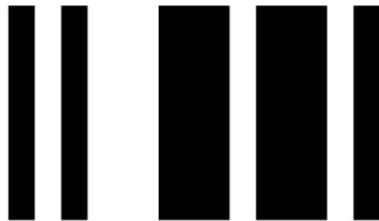
An Grenzen abprallen